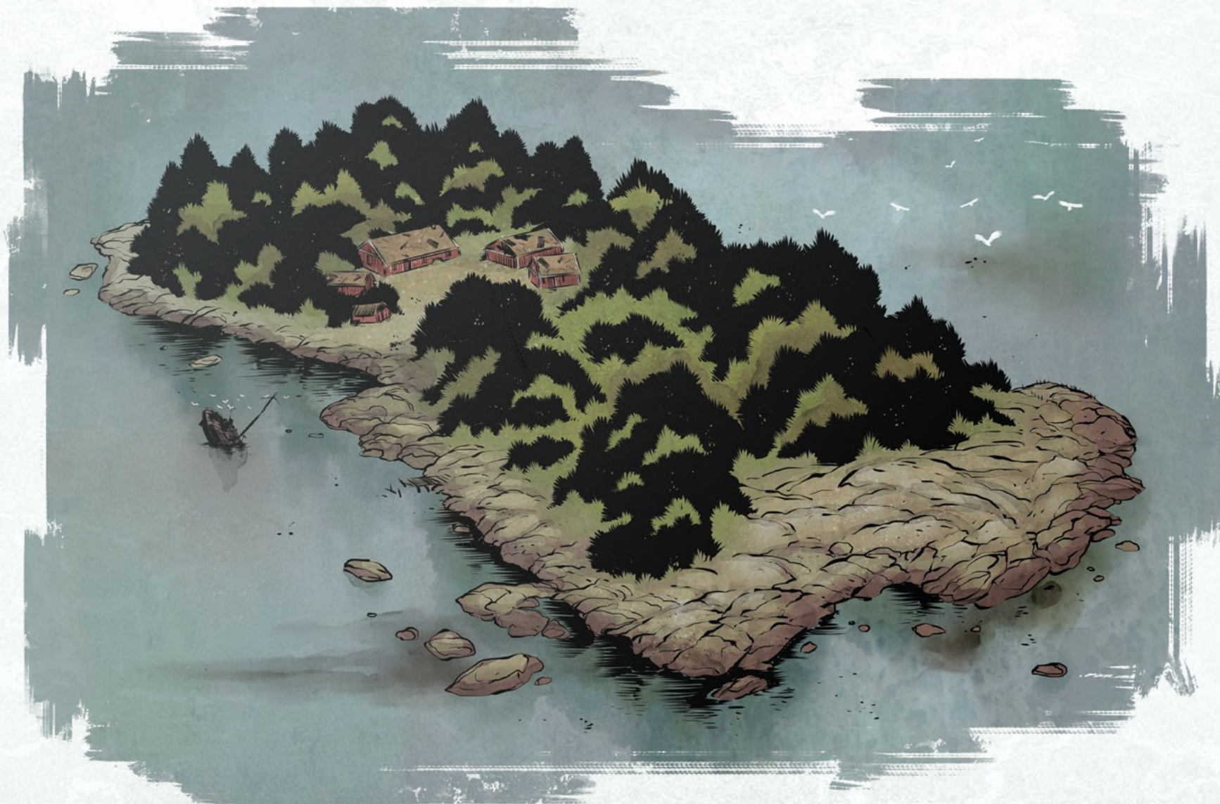
КАРТА ДЛЯ ИГРОКОВ №3: ОСТРОВ ДОКТОРА ВИТЫ